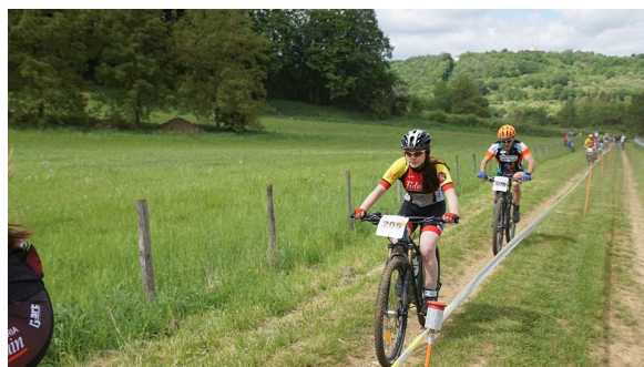
Photos: Fensch vtt Fameck: ci-dessus à Fameck en 2018 une course qu'elle a particulièrement aimé. Ci contre vainqueur du challenge cadette 2018 avec les sœurs Drouet comme dauphines