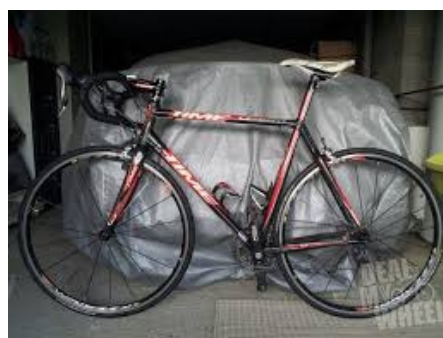
Dénichée sur internet cette photo du Time VXRS ulteam