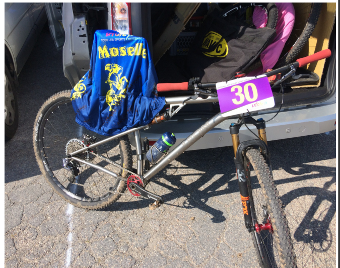
A gauche ci-dessus, la rencontre avec un arbre a fortement marqué Patrick. A droite, le nouveau joujou de Pat, un Léon tout suspendu complète une collection bien fournie. Quand on aime.....