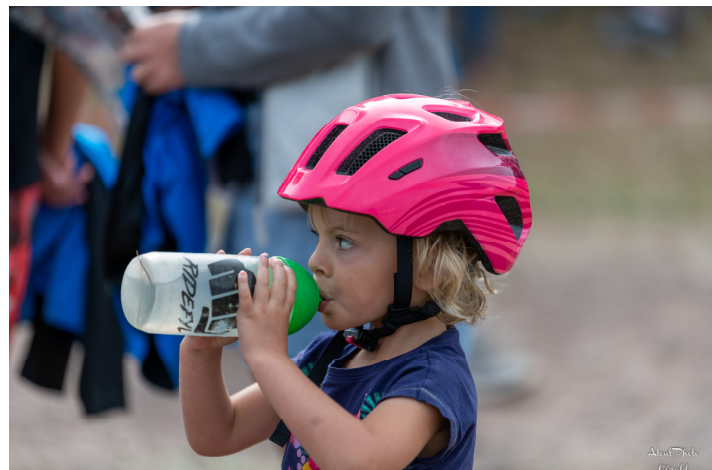
Après l'effort le réconfort