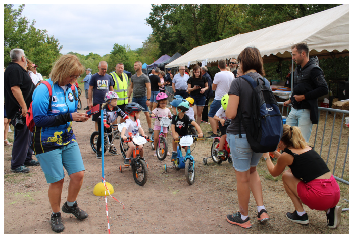
Ci-dessus mise en place des participants....c'est encore le moment de prendre un dernier cliché.