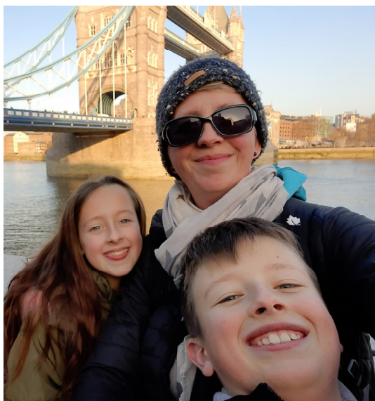
Londres, février 2023. Une occasion de mettre en pratique les cours d'anglais ou était ce pour tester les connaissances des enfants? Une chose est sûre la passion du voyage, de rencontrer des gens est là.

Je prends également des cours d'anglais en visio-conférence avec des natifs et 1h par semaine avec une prof chez elle. En parallèle, j'aime aussi gratter ma guitare. J'écoute beaucoup Vianney et Ed Sheeran. Je lis également, étant une grande fan de lecture et de Netflix. J'aime les thrillers qui viennent du froid comme la série des Milléniums ou les romans de Camilia Lackberg qui sont passionnants. J'encourage de lire « la vérité sur l'affaire Harry Quebert » de Joel Dicker ainsi que tous ses romans. »