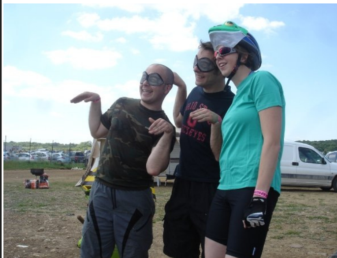
Crapauds: la grenouille et les fourmis.....J'aime l'endurance pour l'ambiance, les valeurs sportives: respect, entraide....

Pour elle le vtt se conjugue également en randonnées: » En fait ce que j'aime surtout dans le vtt, c'est le fait de rouler avec ses amis ou sa famille. J'aime être dans la nature. A la maison, le vtt n'est pas central. On en parle souvent mais ce n'est pas une drogue!! Ce qu'on recherche avant tout, c'est le plaisir, la découverte de nouvelles randonnées. La compétition et les performances sont secondaires »