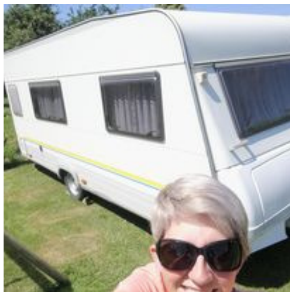
La fameuse caravane qui embarque les trois ou quatre membres de la famille suivant les dates de congés mais toujours en terrain de camping.

ne m'intéresse pas du tout. Par contre, j'adorerais faire la traversée de l'Irlande par exemple mais en dormant dans des gîtes avec l'organisateur qui déplace nos bagages chaque jour. Pour rester au chapitre voyages, en étant enseignante, je bénéficie de pas mal de périodes de congés à la différence de mon mari qui est entrepreneur et j'adore ça. J'ai passé mon permis « caravane » pour pouvoir la manœuvrer. Alors, j'attelle la caravane, ça ne me fait pas peur et avec les enfants nous parcourons certaines régions de France. Le soir nous passons la nuit dans des campings, pour une question de sécurité notamment. Une fois la caravane en place, nous avons plus de liberté avec la voiture pour visiter. On voyage effectivement beaucoup en France. J'aime bien le Jura et le secteur des lacs de Vouglans. Même si cette année, en février, nous sommes allés à Londres. J'ai envie de voyager davantage, de passer un maximum de temps avec mes enfants et ma famille. C'est ma priorité»