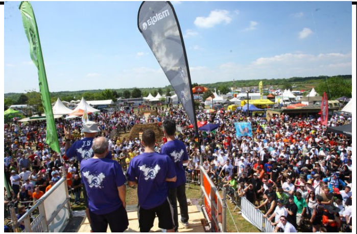
Trois équipes du VCV seront attentives au briefing des Crapauds 2012.....

Pour 2012, la saison est déjà bien arrêtée, au moins dans les intentions. Alors où verra-t-on les maillots du VCV? Marc dévoile une partie des désirs: »Encore une année 2012 bien chargée qui s'annonce avec au programme: de nombreuses randos régionales, les Crapauds, les Pass'Portes du Soleil (dans les Alpes Franc-Suisses), le Roc d'Azur, le Challenge Ufolep VTT XC Lorraine, l'European Mountain Bike Trophy, l'EREC (plusieurs épreuves d'Enduro dans l'Est de la France), .... Ce qui nous promet de belles images plein la tête, de supers souvenirs entre potes, et beaucoup d'anecdotes que nous nous raconterons lors des longues soirées d'hiver ! «