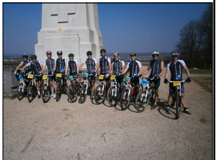
Charmes 2012, les membres du club étaient sans conteste les plus nombreux avec 16 inscrits tout le monde n'est pas sur le cliché.