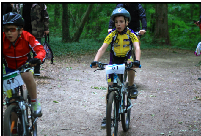
Dure, dure la dernière côte pour les petites jambes ici deux jeunes hommes 7-9ans en action.

celle qui a été retenue). Pour les 11-14 ans, mes conseils ont surtout concerné la distance et le final qui n'apportait pas grand-chose. »