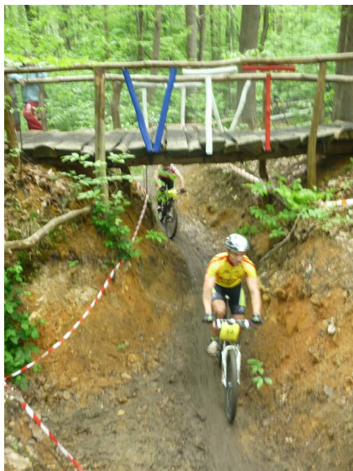
Ci contre le fameux pont dans le bois de Jean, ci-dessous un des passages techniques en tandem.

S C: On verra. Il faut déjà se qualifier et puis faut voir au niveau du boulot.